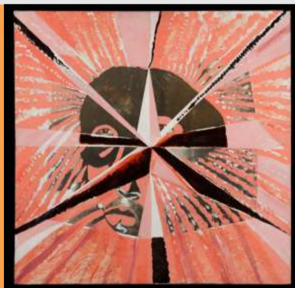
Colagem e acrílica sobre tela da série Índios Brasileiros

Até o dia 8 de fevereiro, estará presente na Galeria Evandro Carneiro Arte a exposição Rubens Gerchman , reunindo trinta obras do artista produzidas entre os anos de 1942 e 2008. Carioca, filho de imigrantes judeus da Ucrânia, Gerchman sempre foi incitado por seus pais à criação artística e cursou a faculdade de Belas Artes quando jovem, tornando-se um artista reconhecido tanto pelos críticos quanto pelo público. A exposição apresenta trabalhos do artista em 50 anos de carreira, com temas variados, como as questões indígenas, futebol, violência cotidiana, natureza, beijos, entre muitos outros. Com curadoria de sua filha, Clara, a exposição pode ser visitada de segunda a sábado, das 10h às 19h, com entrada franca.