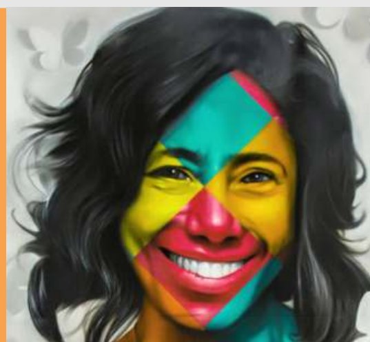
Glória Maria: apresentadora em obra de Eduardo Kobra

Muhcab. Rua Pedro Ernesto, 80, Gamboa. Sáb. (11), 10h. Qua a sáb, 10h/17h. Grátis