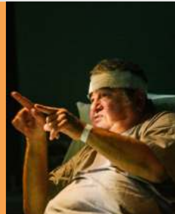
O ator Otávio Augusto em cena na peça A tropa

No Teatro Petra Gold. Rua Conde de Bernadote, 26, Leblon. Sex, 20h30, até 26 de agosto. Ingressos de R$ 35,00 a R$ 70,00 pelo http://www.sympla.com.br .