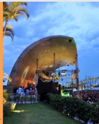
Sombra Projetada: obra de 2008 <-

Parque Garota de Ipanema. Avenida Francisco Bhering, s/nº. Grátis. 6, 13, 20 e 27 de agosto, 9h/21h30. Parque Madureira. Rua Soares Caldeira, 115. 7, 14, 21 e 28 de agosto, 9h/21h30. Grátis