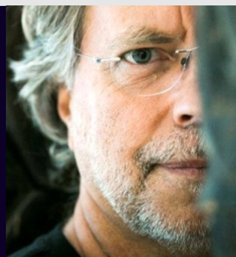
Mia Couto <-

Você sabia que Mia Couto é o pseudônimo de António Emílio Leite Couto, que, além de escritor, é biólogo? E que o autor moçambicano, dentre os muitos prêmios literários que recebeu, ganhou o Prêmio Neustadt, tido como o Nobel Americano? Couto e João Cabral de Melo Neto são os únicos escritores de língua portuguesa que receberam essa honraria. O primeiro romance de Mia Couto, Terra Sonâmbula , foi publicado em Portugal pela Editorial Caminho em 1993. Ganhou o Prêmio Nacional de Ficção da Associação dos Escritores Moçambicanos (1995) e foi considerado um dos doze melhores livros africanos do século XX por um júri criado pela Feira do Livro do Zimbábue. Foi reeditado no Brasil pela Companhia das Letras. A EMERJ iniciará, a partir do dia 14 de setembro, sua Segunda Oficina de Literatura, justamente com o tema: Literatura e Cultura no Continente Africano . Inscrições pelo e-mail emerj.asfoc@tjrj.jus.br