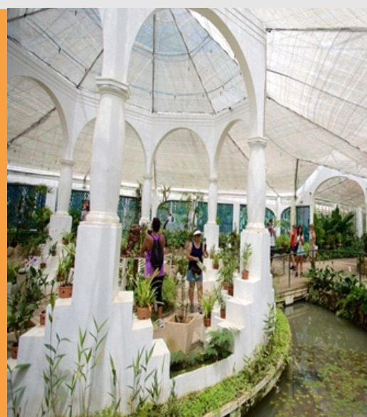
Orquidário do Jardim Botânico do Rio de Janeiro

O Jardim Botânico do Rio de Janeiro inaugurou, no primeiro dia de agosto, um tour em cinco idiomas pelo seu exuberante orquidário, e os passeios não terão custo além do ingresso para acessar o arboreto. Abrigando algumas das flores mais belas e instigantes do Jardim Botânico do Rio, o famoso orquidário passará a ter visitas guiadas em cinco idiomas: português, inglês, francês, espanhol e italiano. Com duração de 40 minutos e grupos de até seis participantes, as visitas ocorrerão sempre às segundas, terças e sextas. No começo da semana, os passeios em espanhol e francês começam ao meio-dia. Nas terças, às 11h, será a vez do português, inglês e italiano. Já às sextas, também às 11h, haverá uma visita em inglês e, ao meio-dia, em português e francês. Além da estufa de vidro e do jardim externo, o orquidário é composto por diversos espaços, incluindo locais de cultivo com acesso apenas para pesquisadores. Para participar das visitas guiadas, é preciso fazer a inscrição gratuita pelos telefones (21) 3874-1808/3874-1214, pelo e-mail cvis@jbrj.gov.br ou diretamente no Centro de Visitantes do JBRJ. Centro de Visitantes do Jardim Botânico do Rio. Rua Jardim Botânico, 1008. 25 e 27/7, 10h. Ingressos para o arboreto entre R$ 9,00 e R$ 73,00 pelo site www.jbrj.eleventickets.com