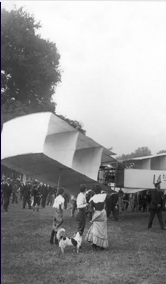
O 14-Bis foi a primeira aeronave mais pesada que o ar a decolar por seus próprios meios; subiu 2 metros de altura e percorreu 60 metros.